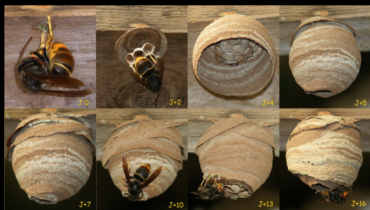
NIDS PRIMAIRES (faciles à détruire)

Le piégeage préventif n'est pas recommandé (risque pour autres insectes) et est réservé aux apiculteurs.