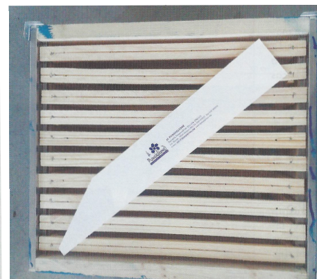
Schéma et photos tirés de La Santé de l'Abeille n°264 : Bandes pour détecter le petit coléoptère de la ruche, par Umberto Vesco + vue en coupe par A. Besson